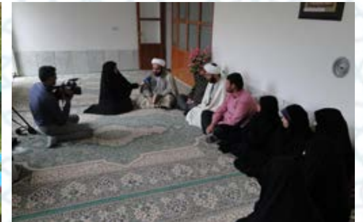
تربیت ۷ حافظ کل قرآن کریم در خانواده‌ای روستایی که ۶ نفر از اعضاء استاد و فعال قرآنی می‌باشند.