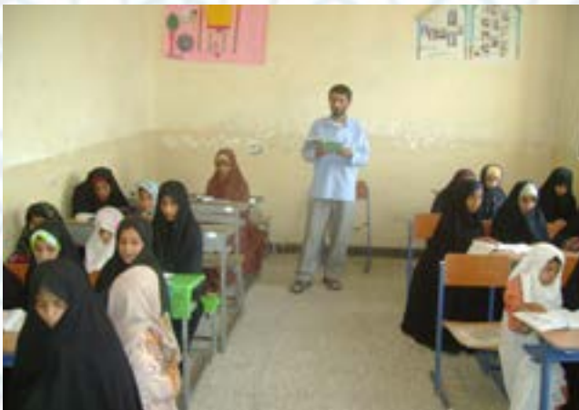
شکل‌گیری روحیه خودباوری در بین حافظان و فعالان روستایی مبنی بر حضور در اقصی نقاط کشور به منظور ترویج آموزه‌های قرآنی