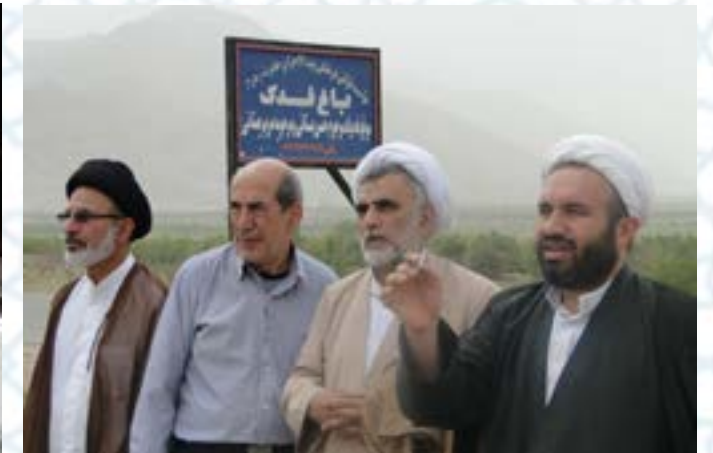
تلاش جهت گسترش و رواج وقف‌های قرآنی با اهدا و وقف بیش از ۱۰۰ قطعه زمین، باغ و خانه به بیت الاحزان