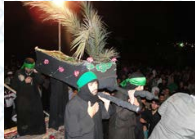
برگزاری مراسم شام غریبان حضرت زهرا (س) با حضور هزاران نفر از عاشقان اهل بیت (ع) و علاقمندان به قرآن کریم