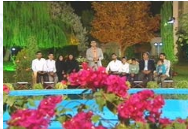
تربیت ۸ حافظ کل در یک خانواده روستایی که دارای ۵ روحانی و طلبه می‌باشند