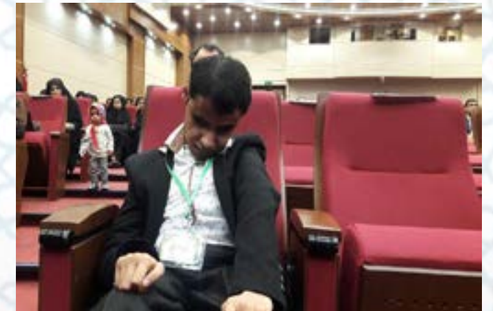
حافظ کل شدن ده‌ها معلول و نابینا که به اقرار آن‌ها امید به زندگی دوباره در آنها به وجود آمده است و این امر بر سایر افراد جامعه اثرگذاری عمیقی داشته است.